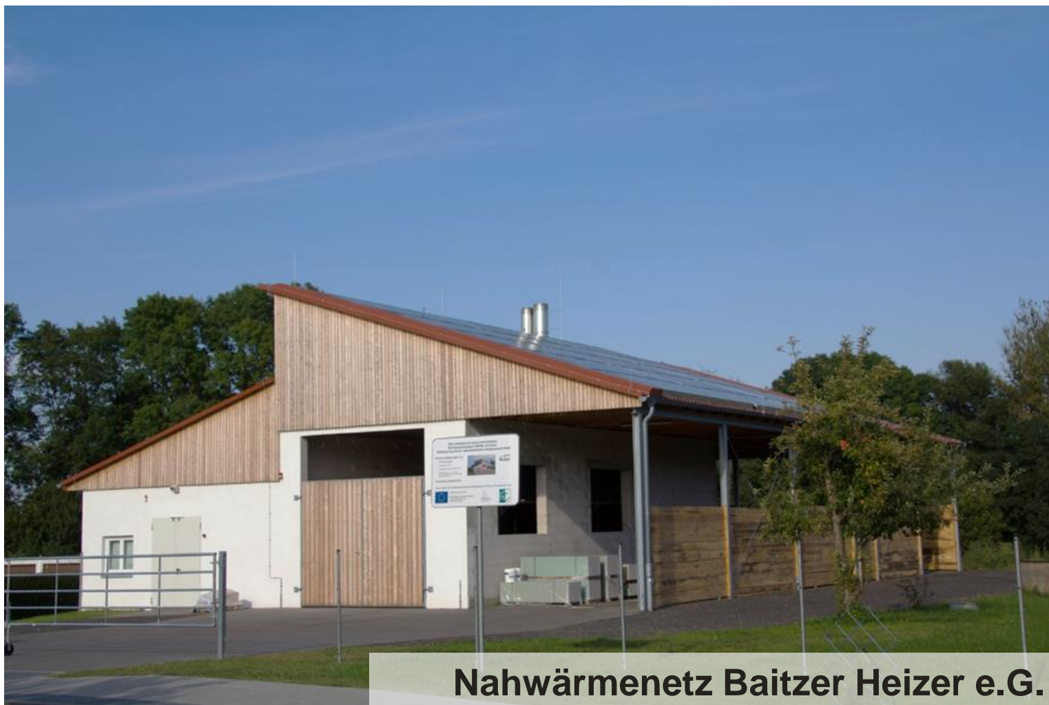
Nahwärmenetz Baitzer Heizer e.G.