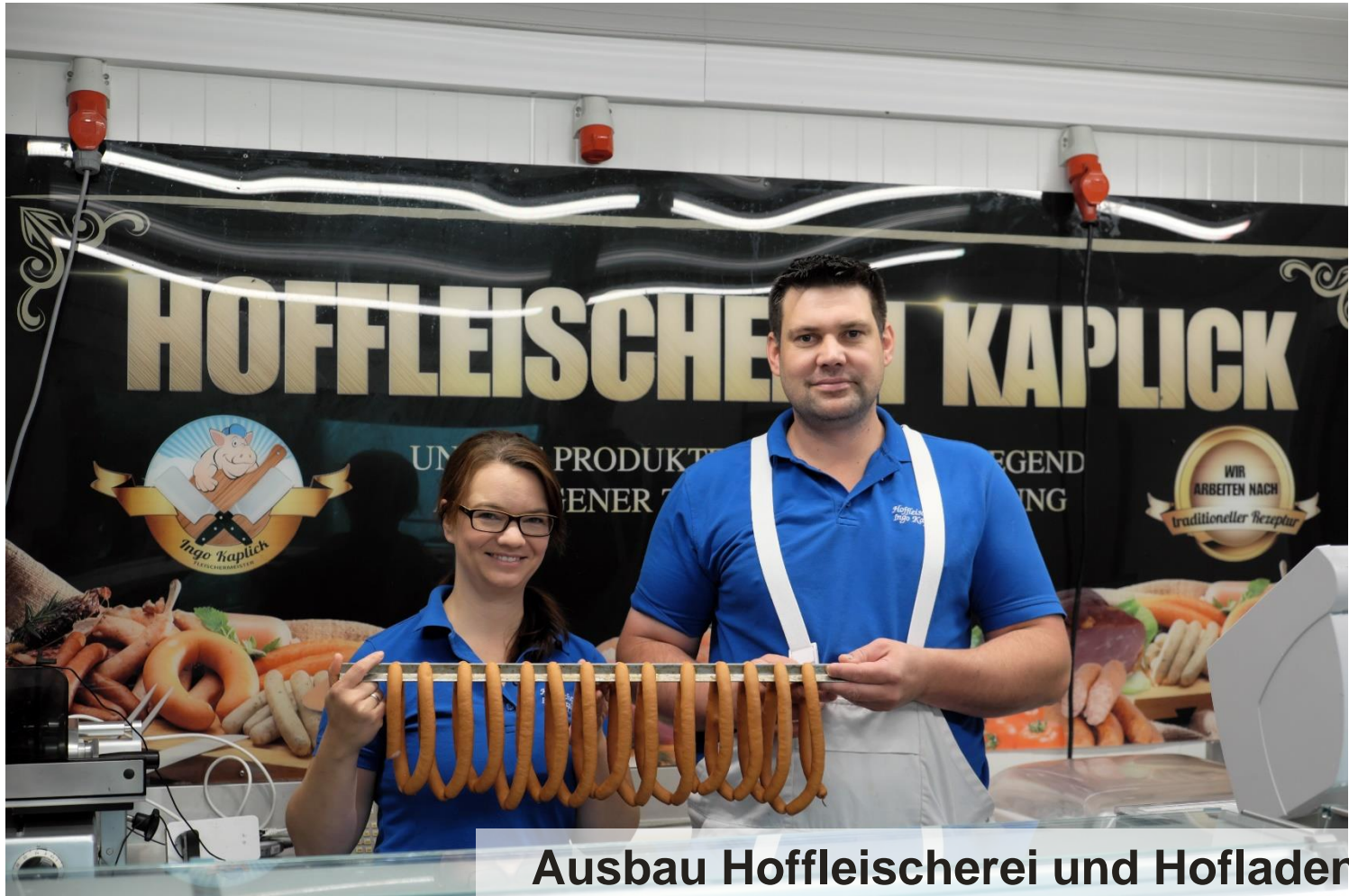
Ausbau Hoffleischerei und Hofladen